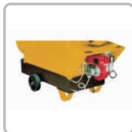
Топливный бак для серии AIR-BUS BV 470 - 4514.098 - 135 дм 3