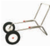
Тележка B35, B70 4103.925