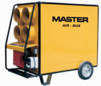
BV 470/690 FS