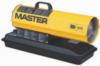
B 35 / B 70CED