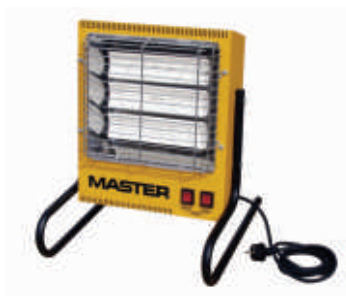
TS 3 A