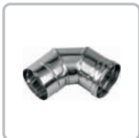
Колено (90°) для отвода отработанных газов из нержавеющей стали Ø 120 мм (BV 77) - 4013.261 Ø 150 мм (BV 110-290) - 4013.247 Ø 200 мм (BV 470, BV 690) - 4013.248