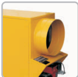
Одиная воздухораспределительная камера для серии AIR-BUS 600 мм (BV 470) - 4514.097 700 мм (BV 690) - 4514.093