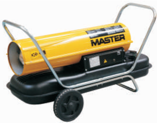
B 100 / B 150CED