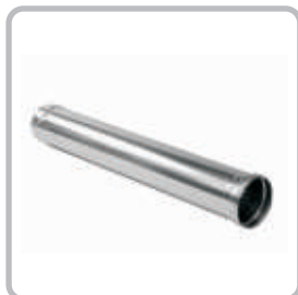
Труба для отвода отработанных газов из нержавеющей стали Ø 120 мм, 1 м (BV 77) - 4013.260 Ø 150 мм, 1 м (BV 110-290) - 4013.243 Ø 200 мм, 1 м (BV 470, BV 690) - 4013.245