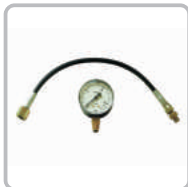
Манометр 0-0,6 бар - B35, B70, B100, B150 - 4109.427 0-16 бар - модели высокого давления - 4109.435