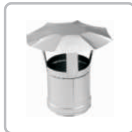
Дымовая труба из нержавеющей стали Ø 120 мм (BV 77) - 4013.262 Ø 150 мм (BV 110-290) - 4013.249 Ø 200 мм (BV 470, BV 690) - 4013.250