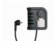
Комнатный термостат ТН 2 с кабелем Диапазон регулирования температур: 0-36°C Точность: ± 1,5°C 4100.426