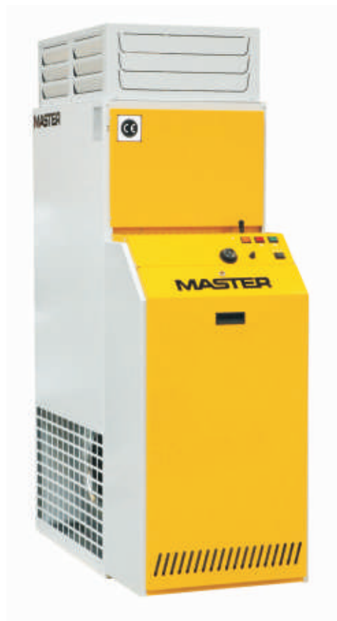
BF 35 – 105