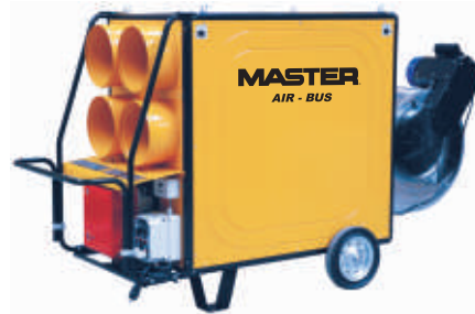
BV 470 FSR