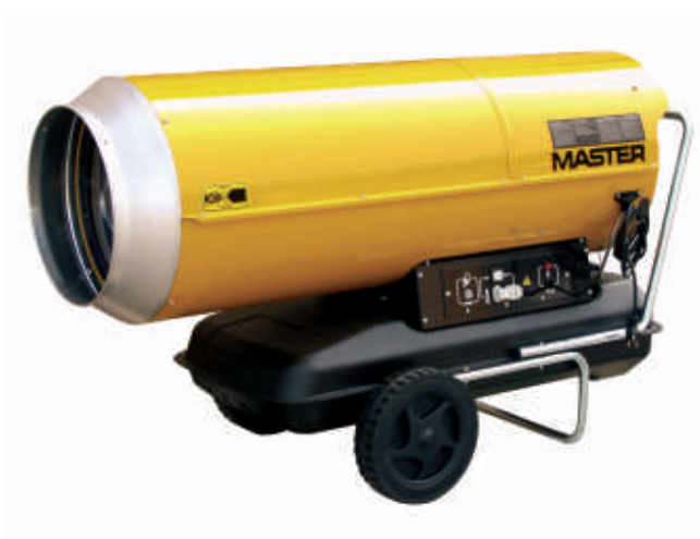
В 230 / В 360