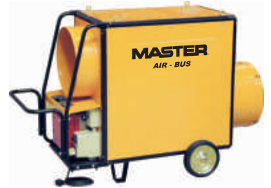
BV 310 FS